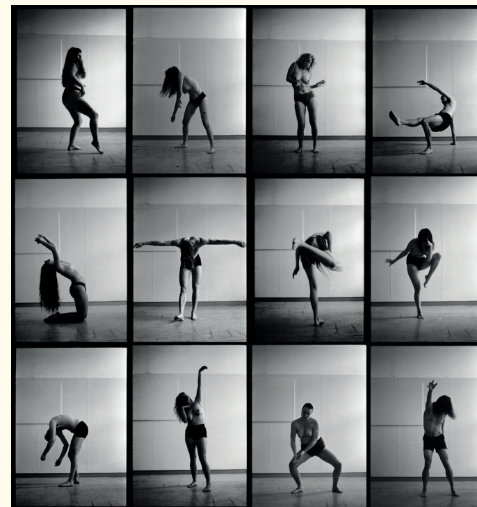
Lijftaal, analoge prints/ analog prints, 2021

verwerken van organisch materiaal is aanvankelijk gruwelijk en vaak emotioneel vermoeiend maar Martens leert zichzelf, als lichamelijk wezen, opnieuw en op een andere manier ervaren en waarderen.